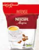
NESCAFÉ Alegria Intense 12x500g