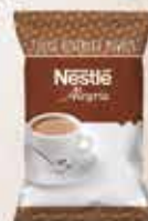
NESTLÉ Alegria Cacaomix Lacté 10x1kg